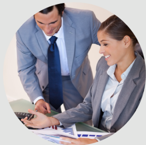
Asesorías Normativas contables