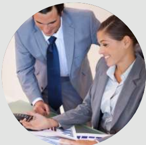
Asesorías Normativas contables